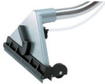
Spray-ex floor alu tool (optional)