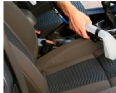
Practical and easy to use