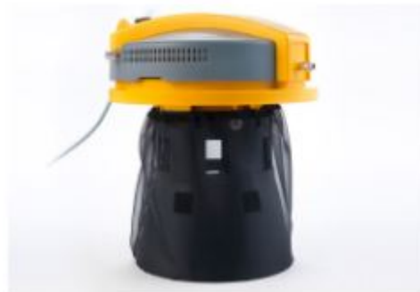
Nylon protection filter