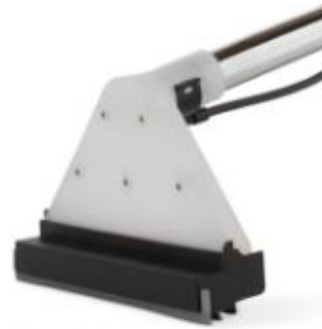
Spray-ex floor tool