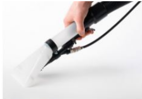
Hand spray-ex tool